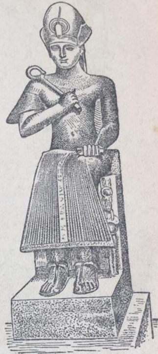
Статуя Рамсеса II.

Около 1300 г. до н. э. на египетский престол вступил Рамсес II. Он собрал большое и сильное войско и повел решительную борьбу с хеттами. Богатые колесничие шли отвоевывать у хеттов земли, с которых они привыкли получать дань. В египетском войске было теперь много наемных воинов — ливийцев и нубийцев. Став во главе армии, Рамсес II двинулся в Сирию. Он хотел разбить хеттского царя одним ударом, но это ему не удалось. Хеттский царь ждал Рамсеса около города К а д е ш а на реке О р о н т е. Когда египетские войска подошли к Кадешу, многочисленная армия хеттов окружила египтян и едва не захватила в плен самого царя. Он спасся благодаря своей необычайной физической силе. Рамсес II был великаном, ростом почти в два метра (об этом можно судить по его мумии). Благодаря мужеству египетских воинов и храбрости фараона, египтянам удалось все же выбраться из кольца врагов и отступить. При этом множество египетских воинов пало под стенами Кадеша.