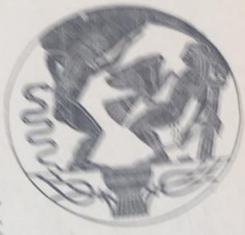
Прометей в Азиях

О происхождении людей у греков была разная сказания. По одному сказанию, как мифе, людей создал не кто-то и не кто-то Прометей. По другому сказанию, Прометей создал людей на основании существ в растениях и животных. Сделал он это, по- хитив у Зевса огонь и научив людей их использовать. Разгневавшись на Прометея Зевс жестоко его наказал. Долго на Кавказе Зевс приказал Prometheus Prometheus жестокими цепями к неприступной скале и ежедневно вставлял на него орла, который клевал печень птицы. Но Про- метей мужественно терпел все страдания и не смирился перед Зевсом.